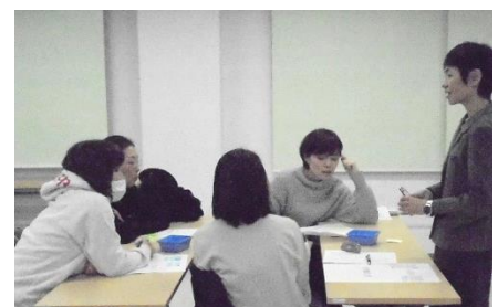
「家族の中の私」で自分自身を知る(第4回)