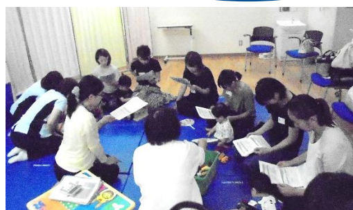
人事課から制度の説明を受けます