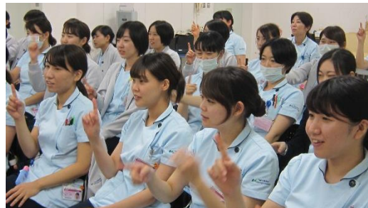
音楽に合わせて体を動かしてみたり…

各自が手に取ったハンドベルでコミュニケーションを取った後、振りをつけながらみんなで歌を歌ったり、音楽に合わせて楽器を鳴らしたりする中で、笑顔が広がって