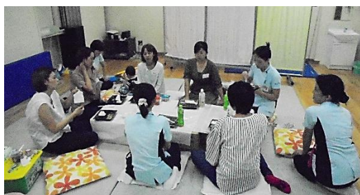
先輩の実体験も参考になります