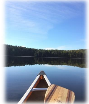
カヤック体験にも挑戦

また、長期休暇を利用して日本へ帰国したり、カナダの豊かな土地でカヤック体験を楽しむ等充実した日々を過ごしています。海外で看護師として活躍される方の話は、学生たちにとって興味深かったようで、「海外で働くという選択肢があることに気付いた」という声も聴かれました。