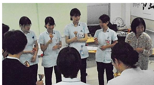
音で会話をしてみたり…

きました。また、講師から聞く患者・家族の体験から「看護師のあたたかい対応で救われた患者もいる」といった内容に新人看護師として看護を見つめ直す機会にもなったようです。