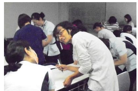
相手を知ること、自分を知ってもらうこと(第1回)