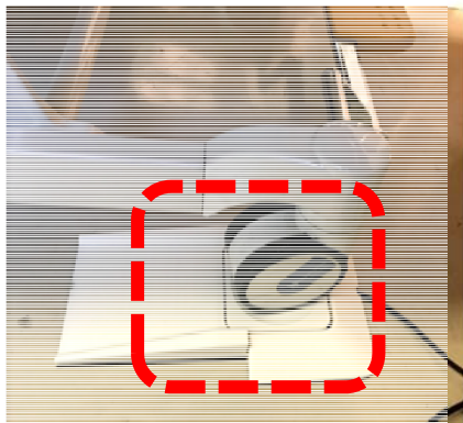
荷重センサーのプロトタイプ